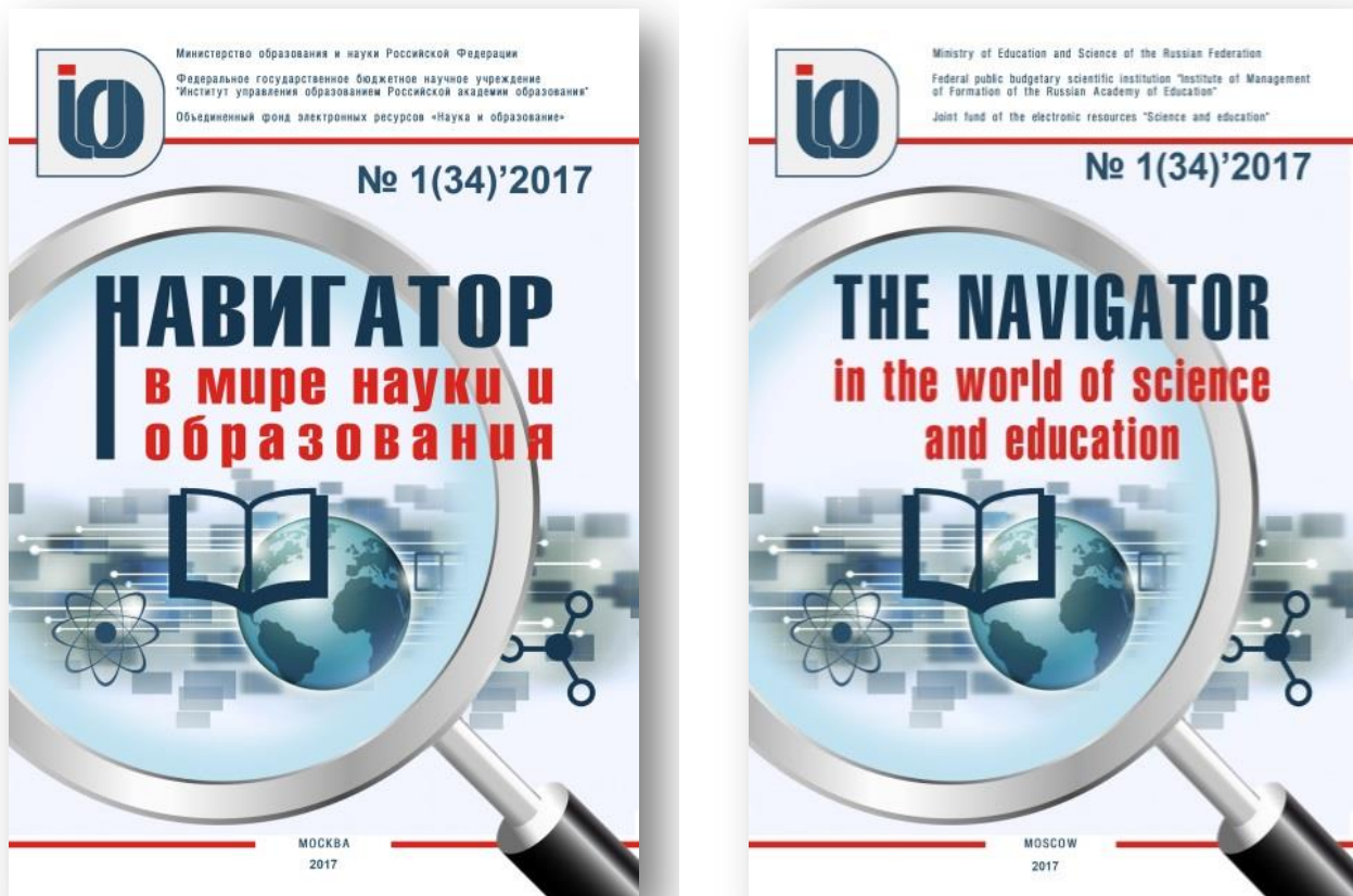
Рисунок 7 Обложки сетевых изданий «Навигатор в мире науки и образования» и «The navigator in the world of science and education»

На данном этапе развития проекта «Современная цифровая образовательная среда в Российской Федерации» востребована коммерциализация научных и образовательных учреждений с учетом прав на результаты интеллектуальной деятельности, в том числе на произведения науки в форме электронных образовательных ресурсов.