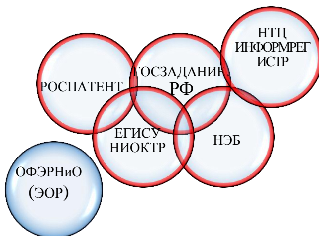
Рисунок 1 Государственная система учета и регистрации результатов интеллектуальной деятельности

На сегодня сложилась система государственного учета и регистрации РИД, участники которой определились в объектах рассмотрения и функциях учета.