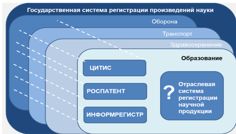
Рисунок 2. Система отраслевой регистрации результатов интеллектуальной деятельности в различных сферах хозяйства страны, обеспечивающих ее безопасность

Эти четыре «НЕ» решает отраслевая регистрация произведений науки в форме электронных образовательных ресурсов. На начало 2000-х годов отраслевая регистрация осуществлялась в обороне, медицине, транспорте, образовании, т.е. в тех сферах, которые отвечают за безопасность страны, в широком смысле этого слова.