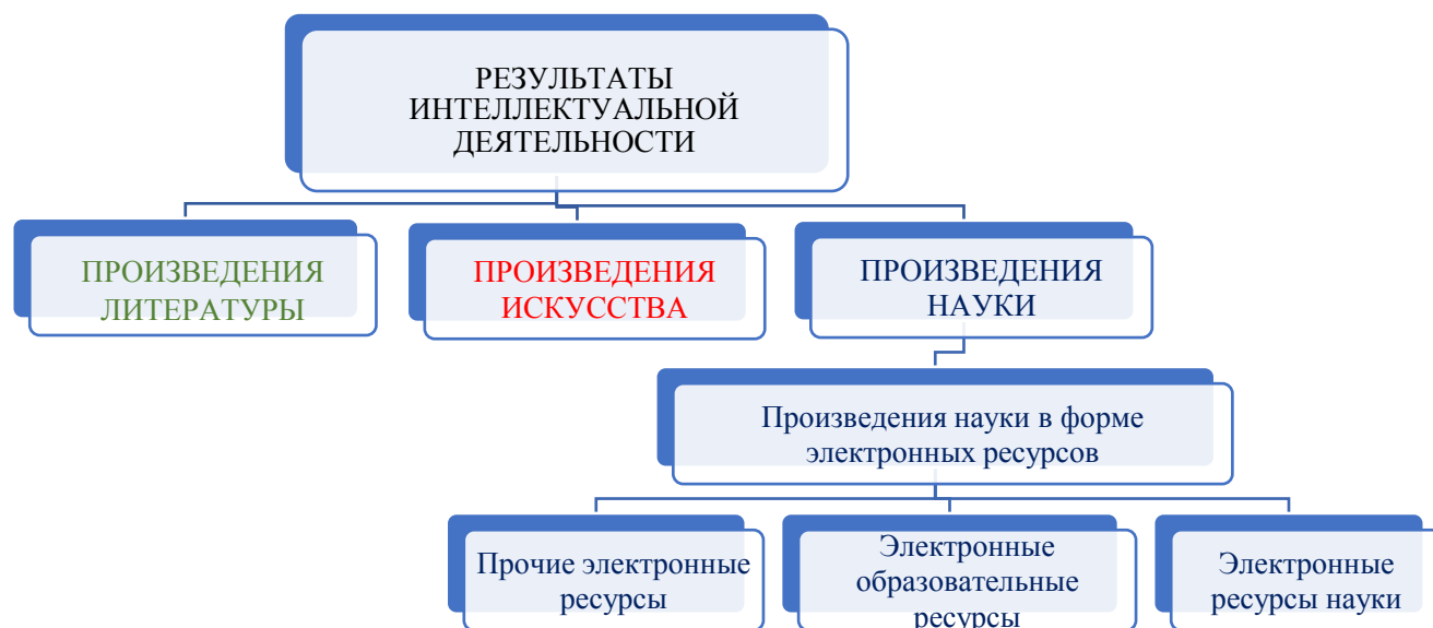
Рисунок 4. Разновидности результатов интеллектуальной деятельности

Авторское право применительно к произведениям науки в любой форме, в том числе к произведениям науки в форме электронного образовательного ресурса.