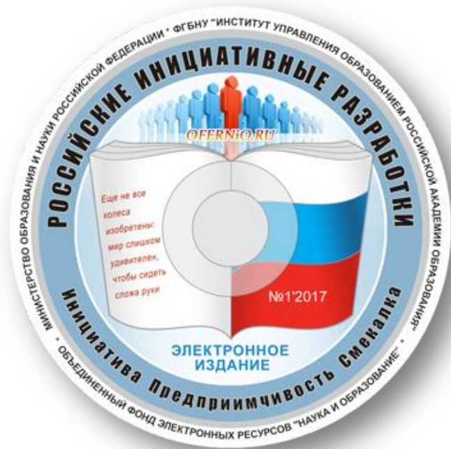
Рисунок 8. Накатка электронного издания «Российские инициативные разработки (Инициатива. Предприимчивость. Смекалка)»

Резюмируя все вышесказанное, формируются следующие выводы: