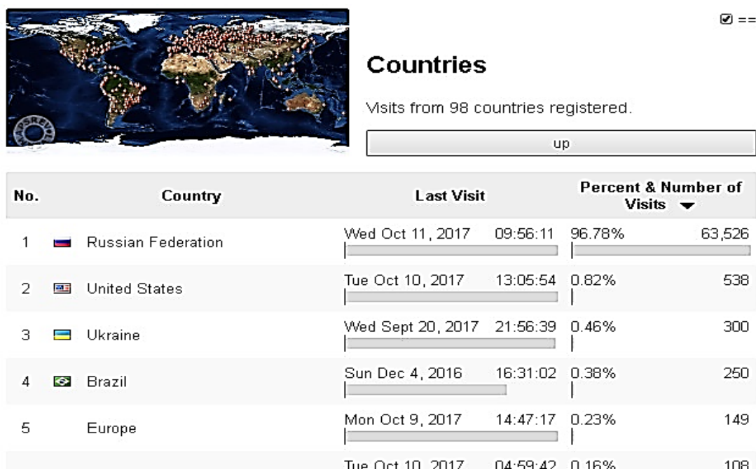
Рисунок 5. География (статистика) посещений портала ОФЭРНиО в части субъектов мира